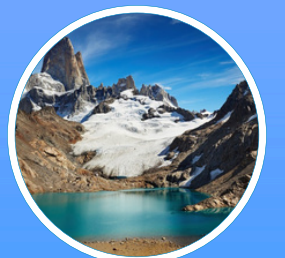
DE LOS TRES